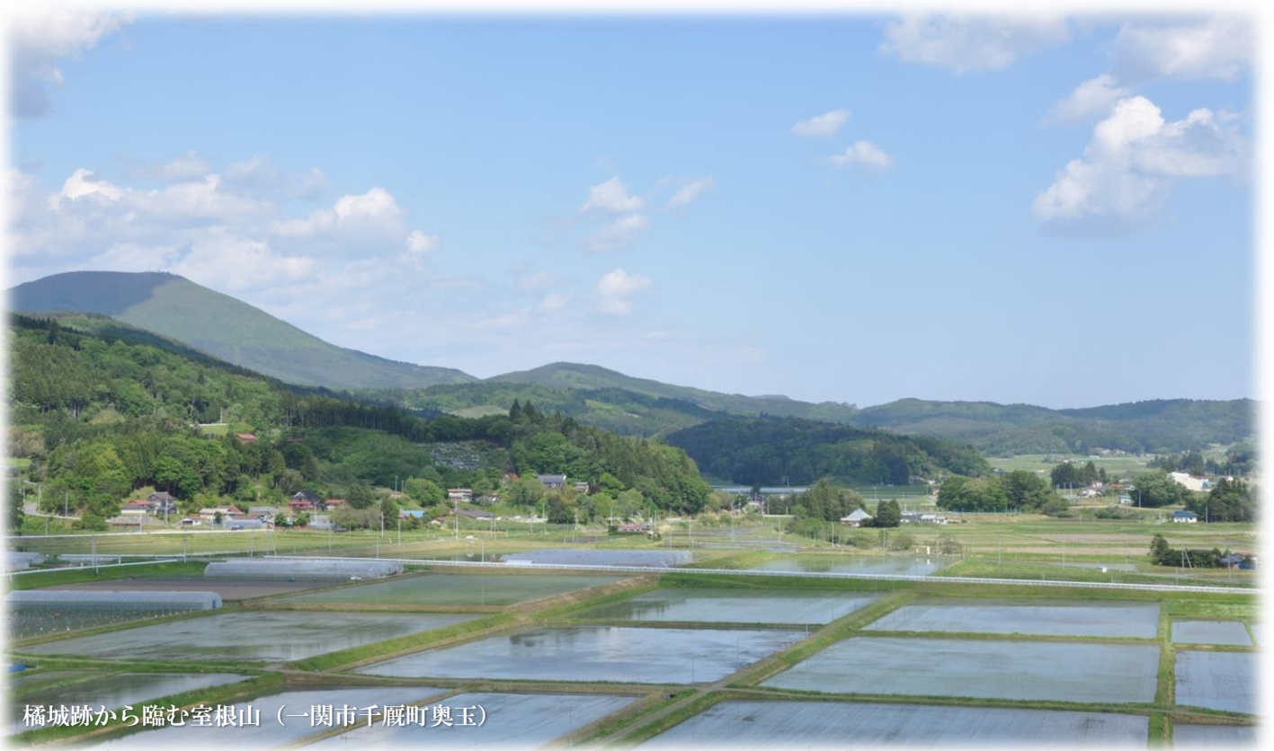
橘城跡から臨む室根山（一関市千厩町奥玉）

～ 平成 27 年 3 月 1 日から平成 28 年 2 月 29 日までの現況 ～