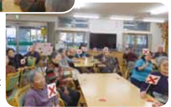
利用者の皆さんが○× で回答。全員大正解！