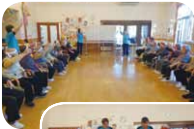
全員で正々堂々競技することを誓いました。