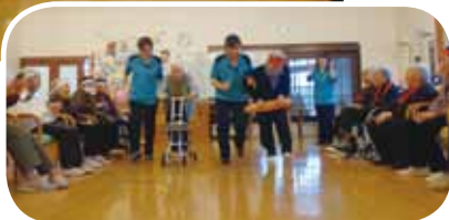
「風船割り競争」応援も盛り上がりました。