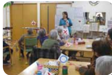
看護師がクイズを出題。 わかるかな～？