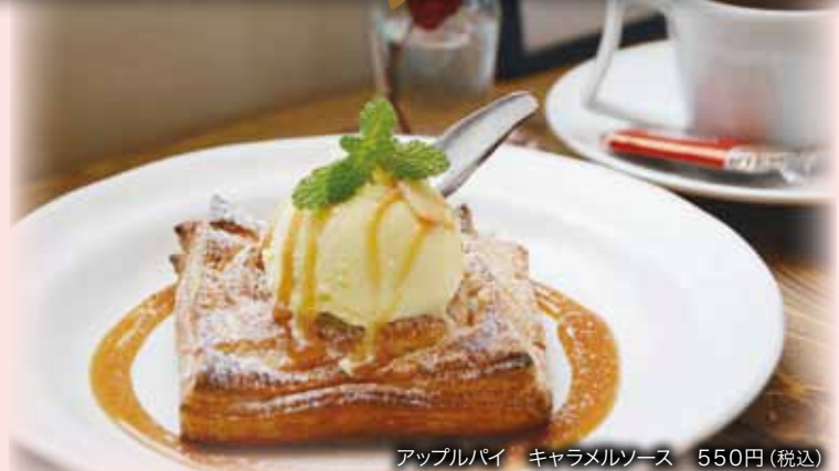
アップルパイ キャラメルソース 550円(税込)