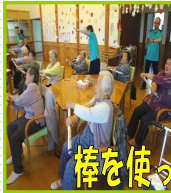
棒を使って準備運動