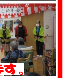
今年もよろしくお願いします。