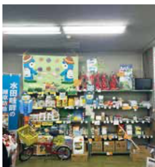
平泉営農経済センター