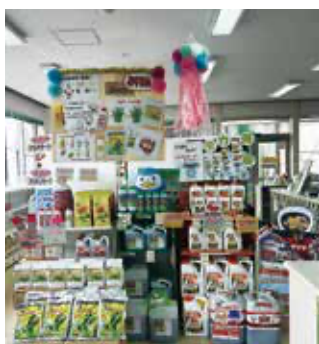
花泉営農経済センター