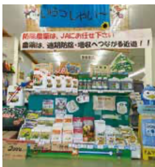
千厩営農経済センター