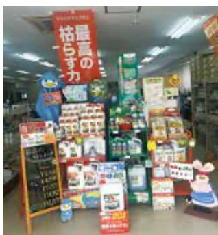
藤沢営農経済センター