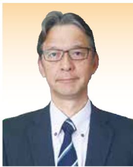
常務理事 (管理・コンプライアンス・監査)

第8号議案において、実務精通役員として理事1名が選任され、総代会後に開催された臨時理事会で常務理事に選任されました。