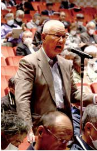
活発な意見が交わされました

A 水稻の農薬や肥料は、大口購入先への直送やロット購入の奨励などで価格を優遇している部分はありますが、あくまで数量を基準としています。