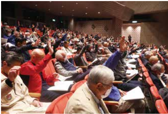
全ての議案が承認されました

A 昨今のキャッシュレス化に伴うものであり、今年度は一関地区で現金支払いの受け付けを終了させていただきました。