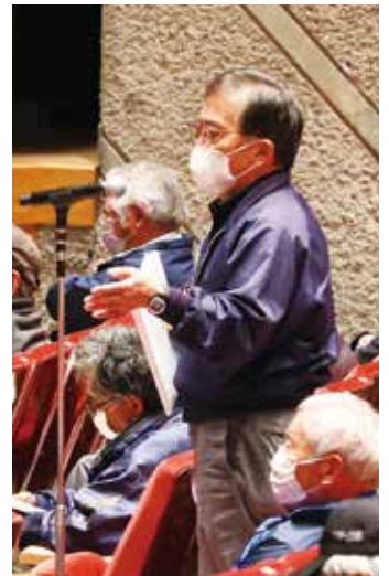
多くの要望も出されました

Q 一日人間ドック・専門ドックについて、昨年度までは支店窓口で支払いができたが、今年度からできなくなった。どうしてか。