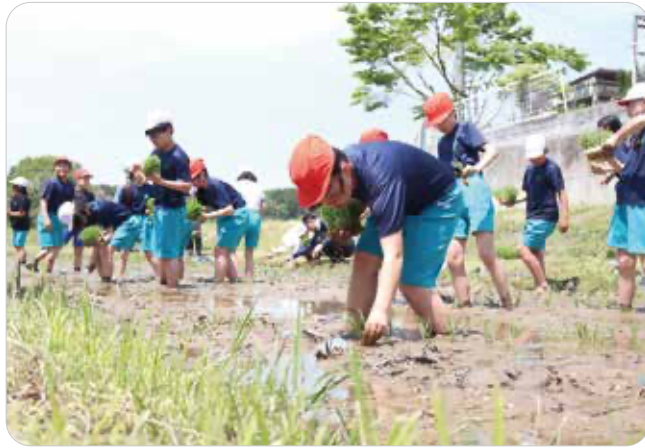
部員の指導を受けてひとめぼれの苗を植える児童

JA一関青年部真滝支部は5月11日、滝沢小学校の田植え体験の指導をしました。5年生23人は4月に種まきした「ひとめぼれ」の苗を、3ヶの水田に手作業で丁寧に植えました。児童たちは泥の感触や田んぼにすむ生き物の様子にびっくりしながら、田植えを楽しみました。今後は稲の成長や水田の周辺環境の観察会を開き、秋には手作業で稲刈りを行う予定です。